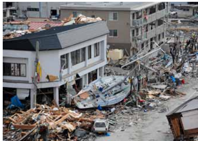
石巻市内