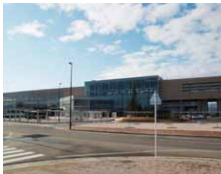
東北新幹線新青森駅舎

◎新青森駅周辺の整備 昨年十一月二日、石江内環状線(マツダドライブインクスクールからフェリー埠頭に抜ける道)が工事費約百六億円を費やし開通致しました。開通に伴い渋滞が緩和され、交通の便も非常に良