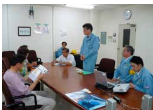
仙台火力発電所での会議