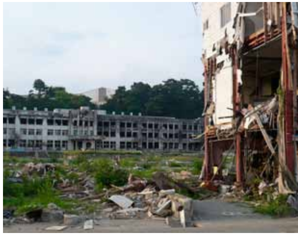
石巻市内 (後方は廃墟と化した小学校)

昨年震災発生以来、数回現地視察して来ましたが、自然災害の脅威に身を震わせ、一日も早い復旧・復興を祈ると共に、今こそ政治家としての使命を全うすべきと、新たに誓い復旧・復興に全力を尽くします。